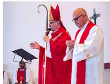
No domingo, 30 de abril, às 11h, Dom Cesar presidiu a Santa Missa de Crisma na Paróquia São Vicente.