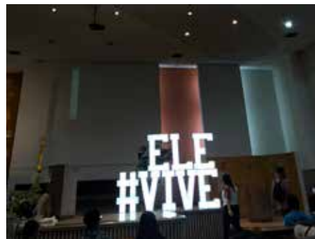
O Setor Juventude da Diocese, realizou no sábado, 15 de abril, às 18h30, na Paróquia N. Sra. de Lourdes o evento: "Ele Vive!", que contou com a presença de Dom Cesar para Missa de abertura, logo em seguida aconteceu um momento de animação e a Via Lucis pelas ruas da paróquia. O evento encerrou na presença de Jesus Eucarístico com um breve momento de Adoração.