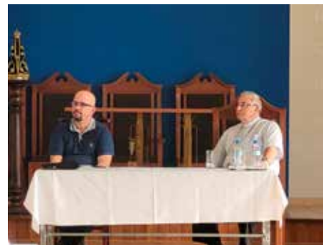
No sábado, 29 de abril, às 14h30, aconteceu a reunião do Conselho Diocesano de Pastoral.