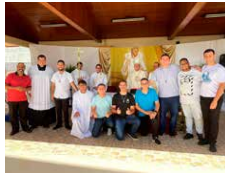
No domingo 16 de abril, às 10h, no Seminário Filosófico Pe. Rodolfo, Dom Cesar presidiu a Eucaristia com o seminaristas e suas famílias. Um momento de comunhão entre o bispo diocesano e as famílias daqueles que se prepararam para a sacerdotio