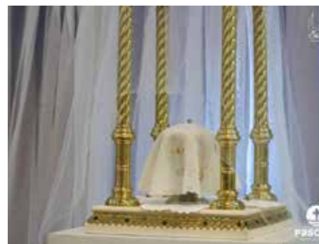
Missa da Ceia do Senhor - Na Quinta-feira Santa, 6 de abril, às 19h30, na Catedral Diocesana São Dimas, aconteceu a Missa da Ceia do Senhor e Lava-pés daqueles que estão sendo atendidos atualmente na Fazenda da Esperança Casa Logos.