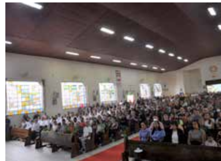
Domingo de Ramos – N. Sra. de Guadalupe – O Domingo de Ramos, dia 2 de abril, foi na Paróquia N. Sra. de Guadalupe, foi marcado pela tradicional Procissão e Missa, às 08h30