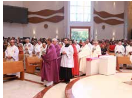
Missa Crismal - Na Quinta-feira Santa, 6 de abril, às 10h, na Catedral Diocesana São Dimas, aconteceu a Missa Crismal, que reuniu todos os padres, diáconos, candidatos ao diaconato, seminaristas, leigos e leigas.