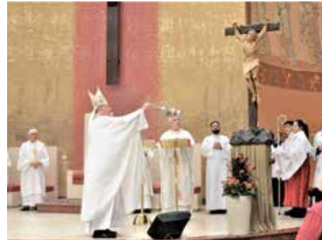
A Paróquia Catedral São Dimas realizou no mês de abril a Novena e Festa do padroeiro da comunidade. Dom Cesar presidiu no dia 14 de abril, às 19h30, Catedral São Dimas.