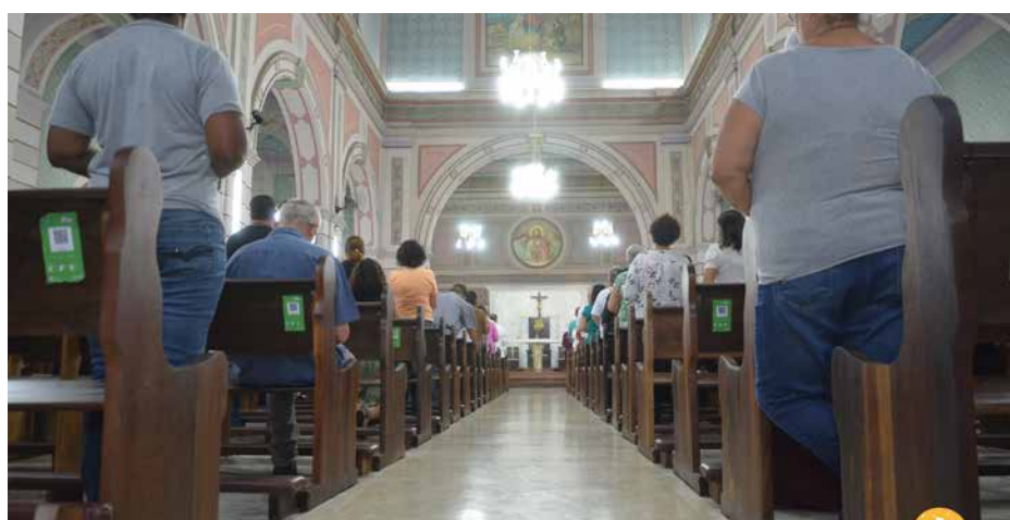
No dia 16 de março, Dom Cesar celebrou o 1º dia do Tríduo em honra a São José, na Igreja Matriz da cidade de São José dos Campos.