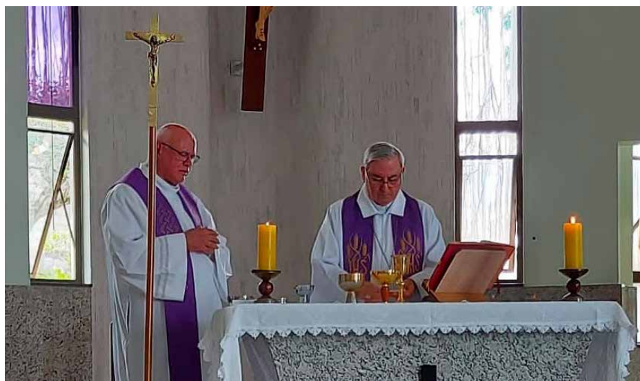
Dom Cesar presidiu a Santa Missa no dia 12 de março, às 11h, na Casa de Retiros Coração de Jesus, durante o Encontro Estadual da RCC. Um momento muito significativo para os membros deste movimento.