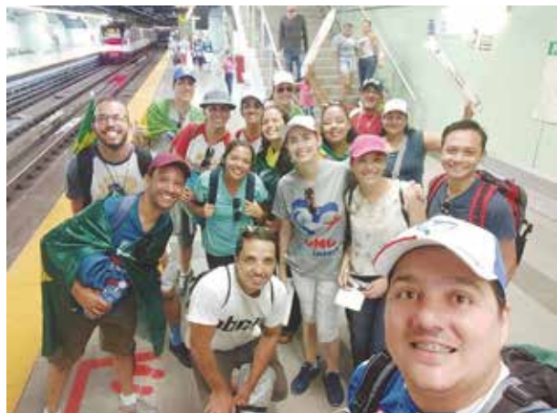
Grupo da Paróquia Nossa Senhora de Guadalupe

Fizeram parte do grupo de peregrinos da diocese, jovens das Paróquia Nossa Senhora de Guadalupe, Paróquia Nossa Senhora da Santíssima Trindade, Paróquia Santa Cecília, Paróquia Coração de Jesus e Paróquia Espírito Santo.