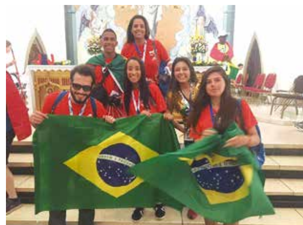
Peregrinos da Paróquia Espírito Santo