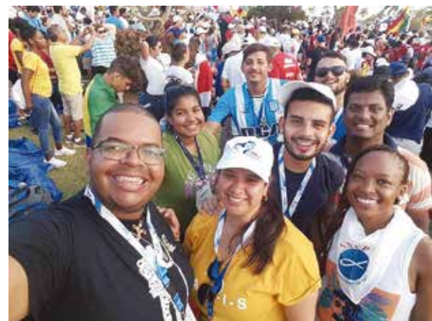
Juventude Vicentina na JMJ