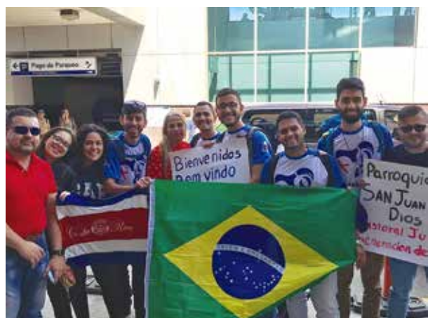
Peregrinos joseenses e da Costa Rica