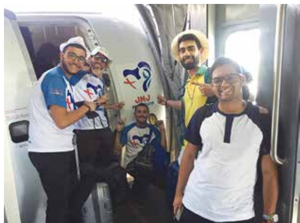
Paróquia Coração de Jesus presente na JMJ