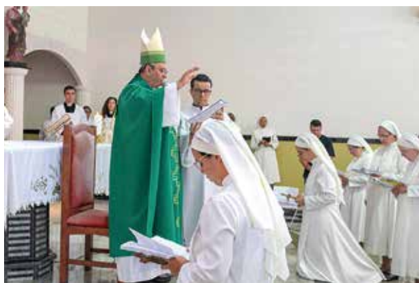
Missa de Profissão Perpétua e Jubileu de Prata e Ouro das Irmãs Pequenas Missionárias.