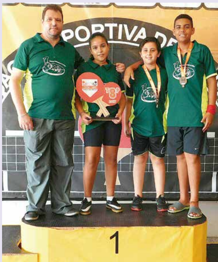
A Secretaria de Esportes, por meio do Atleta Cidadão, passou a subsidiar a participação de atletas em competições