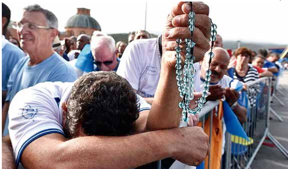
Romaria do Terço dos Homens completou 10 anos em 2018

Na programação da edição de 2018 da Romaria, a missa