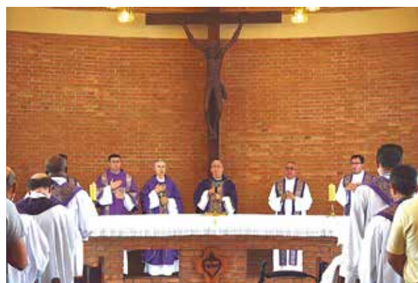
Missa de Abertura do Ano Letivo da Faculdade Dehoniana.