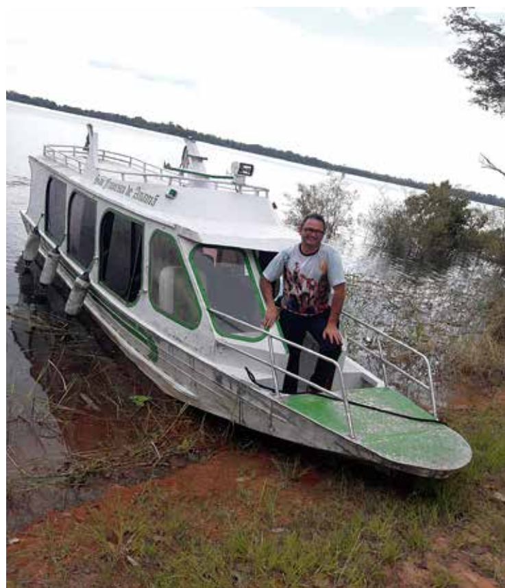
O barco paroquial funciona como o principal meio de acesso às comunidades mais distantes

Por conta da distância entre as comunidades, algumas recebem a visita apenas duas vezes ao ano. As estradas dão lugar aos