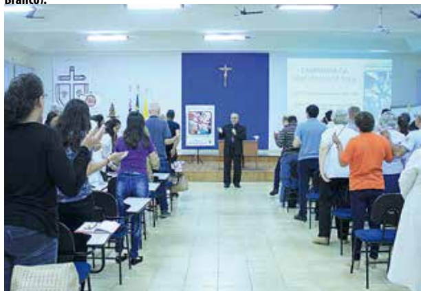
Lançamento do Texto Base da CF 2018