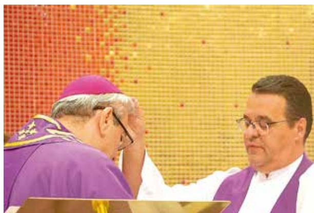
Missa de Cinzas e Abertura CF 2018.