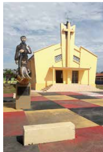
Paróquia Santuário São Francisco

A Diocese de Coari conta com uma população aproximada de 200 mil habitantes, com 85% de católicos. O território da diocese é de 135 mil quilômetros quadrados, organizado em 10 paróquias. O clero é formado por 14 sacerdotes e um diácono transitório.