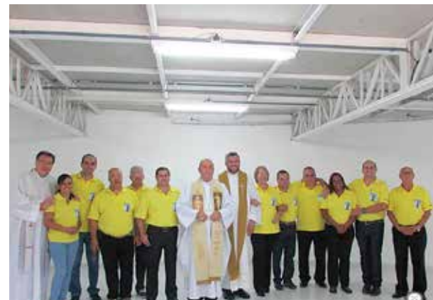
Inauguração da Quadra na Obra Social da Paróquia N. Sra. do Rosário.