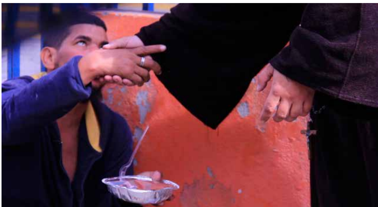
Foto da pastoral de rua em 2019

Leia a mensagem do Papa na íntegra, clicando aqui: AQUI