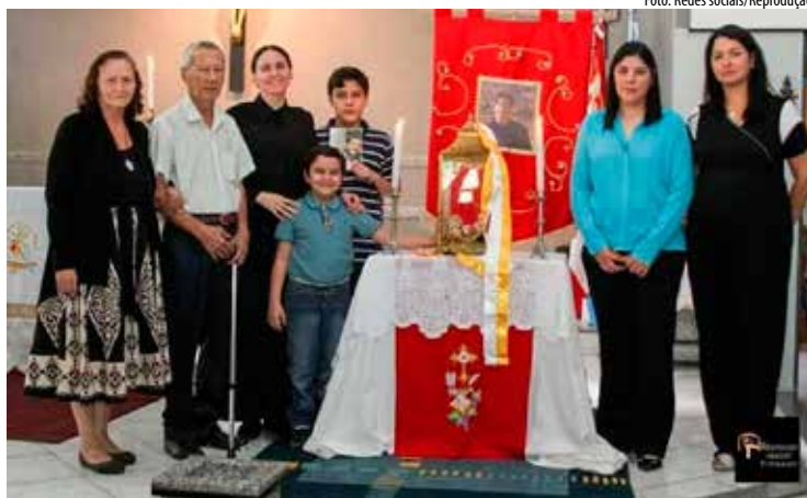
Avô, menino que recebeu milagre e familiares na paróquia em MS