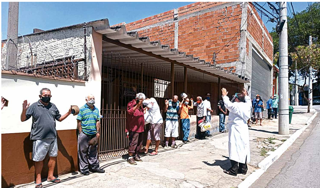
Fraternidade Casa de Assis realizando uma Ação Social de entrega de marmitas

O objetivo de cada ação humana, recorda por fim o Papa, só pode ser o amor: tal é o objetivo para onde