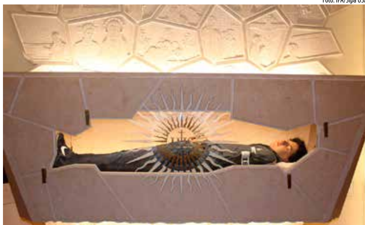
Corpo de Carlo Acutis

No Instituto Liceo Classico Leão XIII, onde iniciou o ensino médio, desenvolveu sua paixão por computadores. Carlo criou um site dedicado aos milagres eucarísticos e à vida dos santos. "Decidi ajudá-los — dizia o jovem na página da internet — compartilhando alguns dos meus segredos mais especiais para aqueles que desejam rapidamente alcançar a meta da santidade". Carlo Acutis insistia na Missa diária, na récita do Rosário, na lectio divina, na Confissão e no apego aos santos. "Peça ao seu Anjo da Guarda para ajudá-lo continuamente,