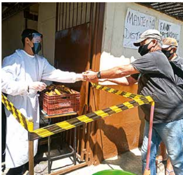
Irmão da Casa de Assis entregando a marmita

então a mão estendida enriquecer-se sempre com o sorriso de quem não faz pesar a sua presença nem a ajuda que presta, mas alegra-se apenas em viver o estilo dos discípulos de Cristo”.