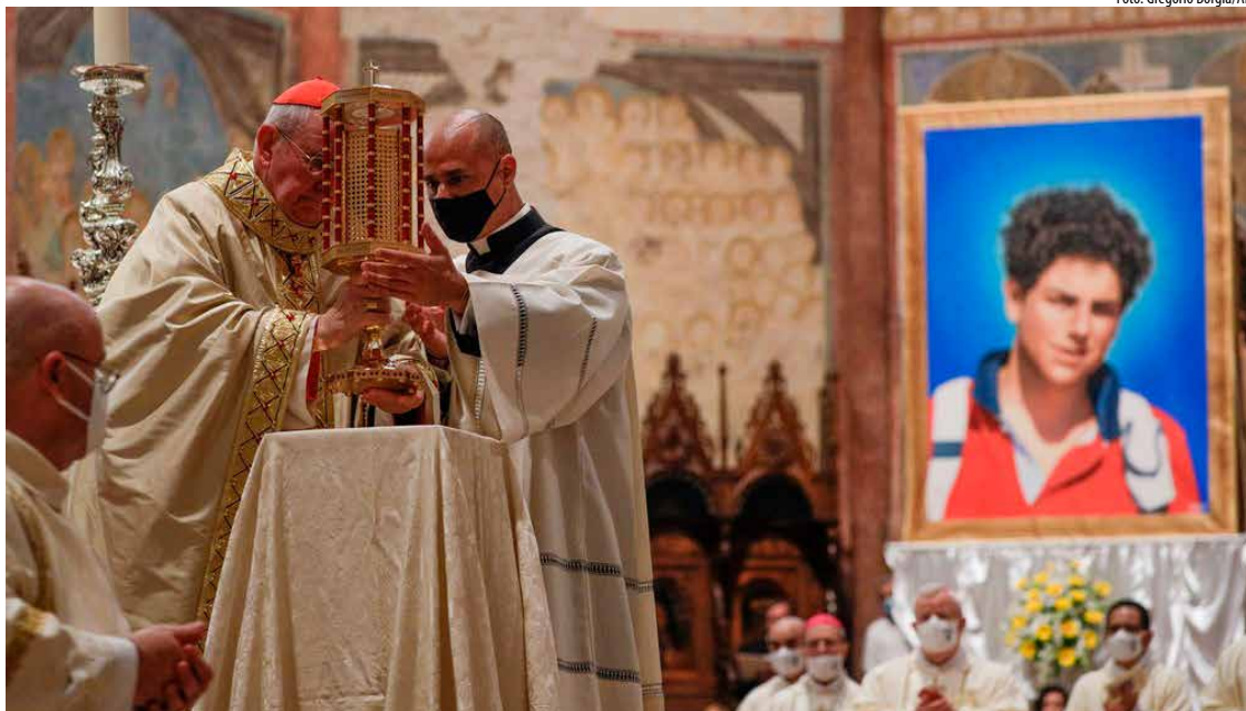
Cerimônia de beatificação de Acutis

Tamanha espiritualidade chamava a atenção dos mais próximos. Certa vez, preferiu participar de uma peregrinação a Assis, Itália, a visitar outros lugares para diversão. O compor-