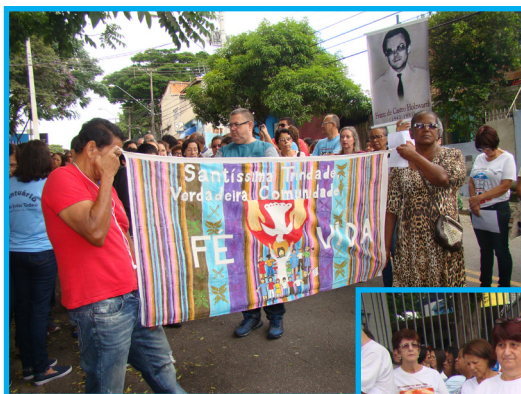
Encontro Diocesano das CEBs - março 2019