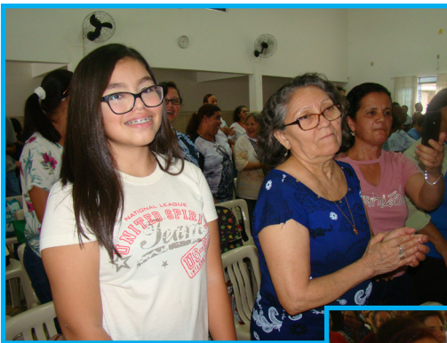
Encontro Diocesano das CEBs - março 2019