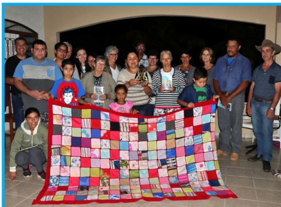
Encontro nas casas - Comunidade Rural