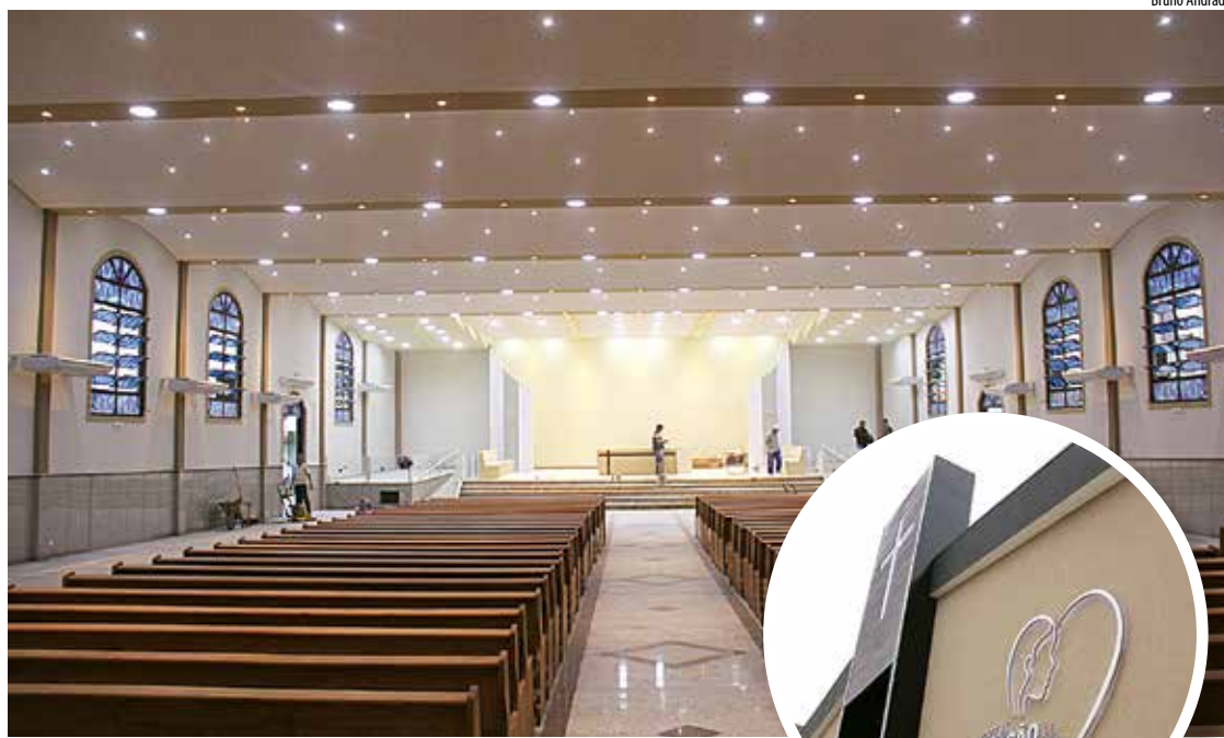
Obra da Igreja Coração de Maria, Paróquia Coração de Jesus

Todas as missas que lá aconteciam foram transferidas para o Centro de Evangelização na Matriz da comunidade. Foram diversas