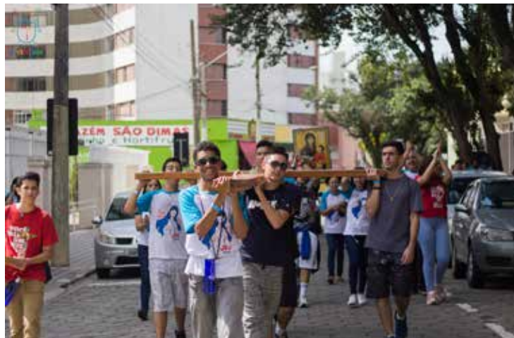
Caminhada pelas ruas centrais de São José dos Campos