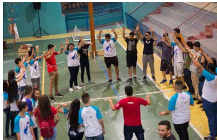
Oratório festivo na Escola João Cursino