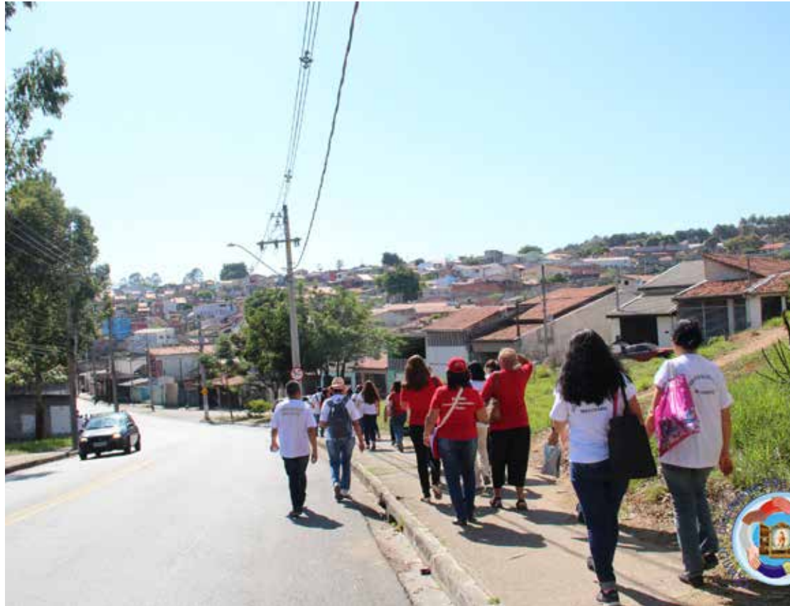
É preciso coragem para o trabalho de evangelização no mundo urbano

Uma das grandes obras do grande teólogo Santo Agostinho é "A cidade de Deus", onde aborda os desafios da evangelização nos tempos da Igreja dos primeiros séculos do cristianismo. Santo Agostinho apresenta os desafios da cidade de Deus em contraponto com a cidade dos homens.