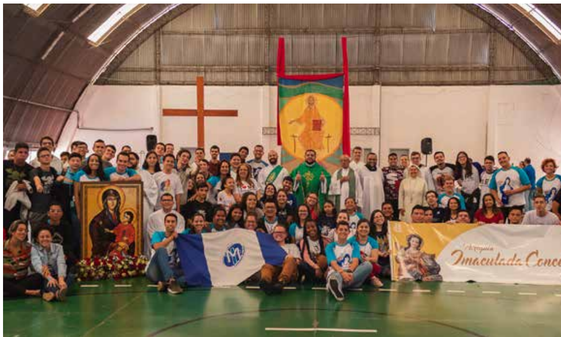
Rumo à próxima edição da JDJ em 2022