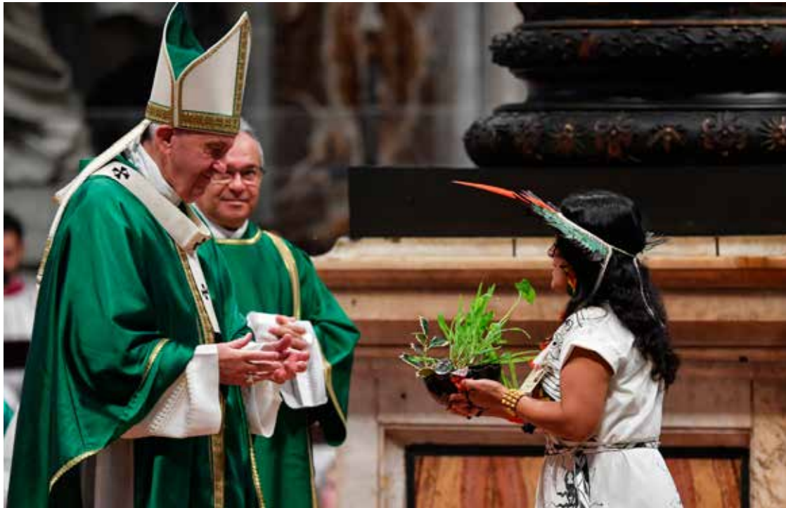
Papa recebe planta de indígena como símbolo da Amazônia

Documento final. O Documento final do Sínodo dos Bispos para a região Pan-Amazônica foi votado e aprovado no dia 26 de