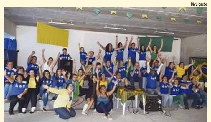
O salão da Obra Social da Paróquia Nossa Senhora da Soledade deu espaço ao Arena Soledade para exibição dos jogos da seleção brasileira durante a Copa.

A Copa do Mundo 2018 foi de grandes emoções, sobretudo para os torcedores da seleção brasileira de futebol. Sediada na Rússia, 32 nações disputaram o título do Campeonato Mundial de Futebol e os jogos acontecem em 11 cidades e 12 estádios espalhados pelo país sede.