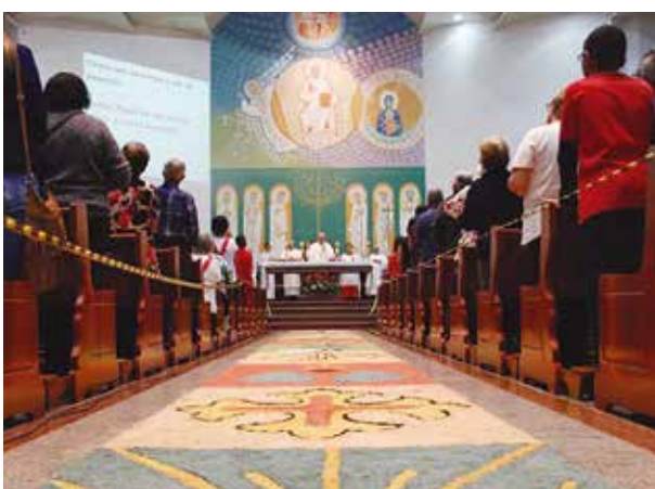
Santuário São Judas Tadeu