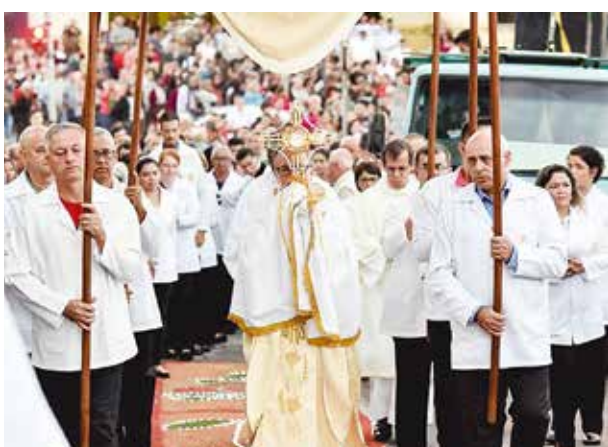
Paróquia Nossa Senhora de Fátima (Altos de Santana)