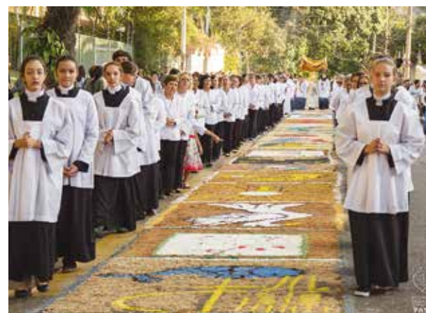
Paróquia Sagrada Família