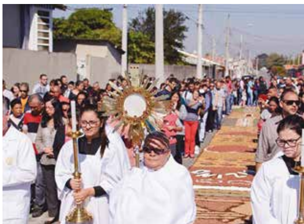
Paróquia São José Operário (Jacarei)

Todos os anos a Igreja celebra com grande solenidade a festa do “Corpo e Sangue de Cristo”, mais conhecida com o ‘título’ em latim, Corpus Christi. A procissão torna-se um verdadeiro testemunho do Senhor que continua ‘no meio de nós’ e sinal de sua presença em nossa vida do dia-a-dia. É nesse clima fraterno que os fiéis da Diocese de São José dos Campos se unem durante a madrugada que antecede a celebração do Mistério Eucarístico para confeccionarem os tradicionais e famosos tapetes de Corpus Christi. Materiais como borra de café, farinha, areia, sal, serragem, e os recicláveis, como tampinhas de garrafas, bagaço de cana, casca de arroz, flores e folhas, dão forma e cores ao caminho por onde passará o Corpo de Cristo. No Brasil, essa tradição acontece em inúmeras cidades e envolve toda a comunidade que a cada ano busca se superar na montagem dos tapetes.