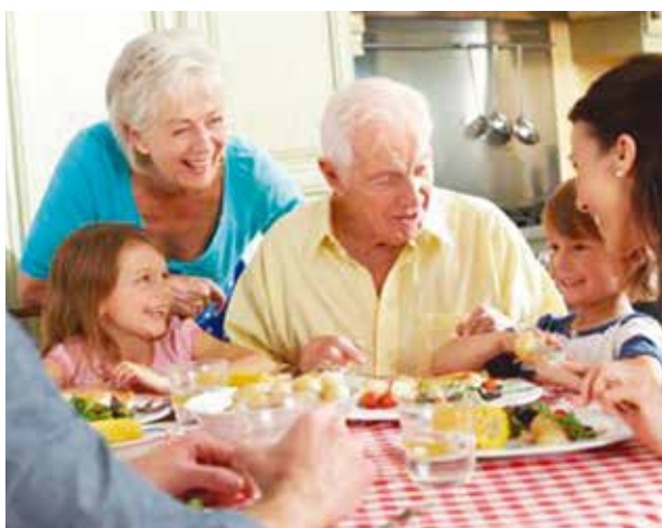
És progenitor, avô ou avó? Sê santo, ensinando com paciência as crianças a seguirem Jesus.