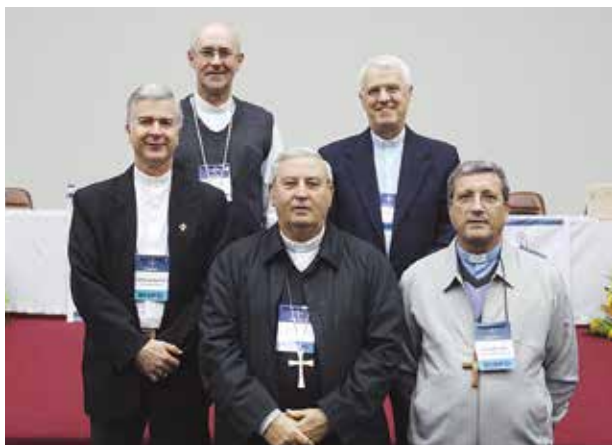
Assembleia da CNBB Regional Sul 1 reúne bispos, padres e diáconos assessores do Estado de São Paulo.