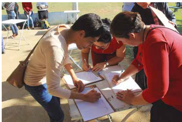
Uma das ações concretas do evento foi a coleta de assinaturas para um abaixo-assinado contra o corte de 430 árvores de uma área verde na Avenida Tívoli, que fica na região central de São José dos Campos.

Ao longo do mês, os cooperados participaram de algumas ações voltadas para a reflexão do cuidado com a Casa Comum. Também marcaram presença no dia 10 de junho, no Parque Vicentina Aranha, em um evento sobre o descarte e o armazena-