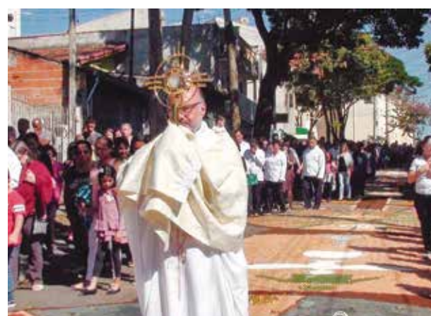
Paróquia São Paulo Apóstolo