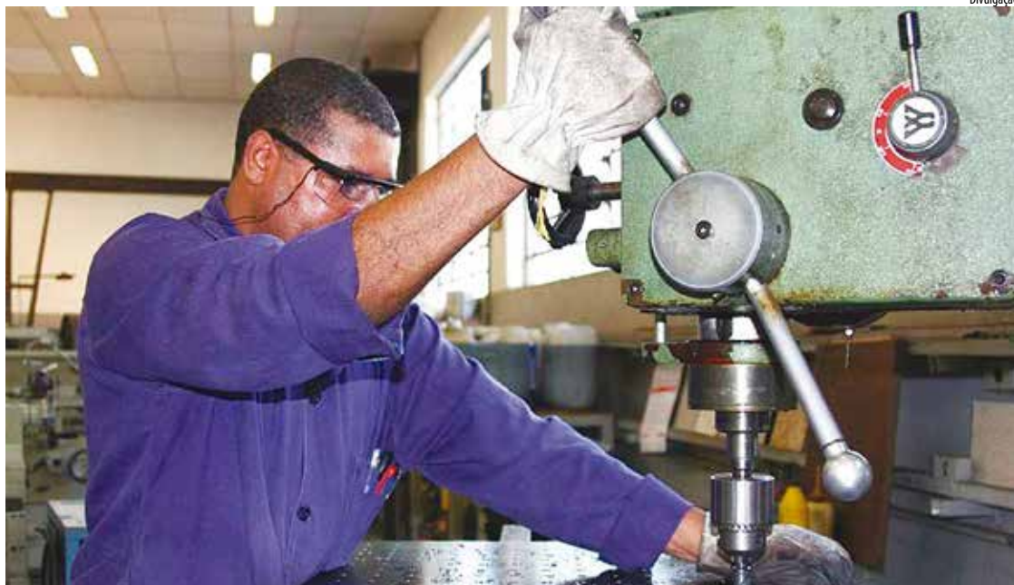
"És um trabalhador? Sê santo, cumprindo com honestidade e competência o teu trabalho ao serviço dos irmãos." - Papa Francisco

Essas palavras mostram duas exigências da santidade: uma material – ("faz o que deves": cumprir o pequeno dever de cada momento, e cumpri-lo sem atrasos hoje, sempre, agora) e outra formal ("está no que fazes" – cumpri-lo com perfeição e empenho por amor a Deus). Estas duas exigências convergem para uma só: o cuidado amoroso das coisas pequenas. Porque, na prática, os próprios deveres não são coisas materialmente grandes, mas "pequenos deveres" de cada momento; e porque a