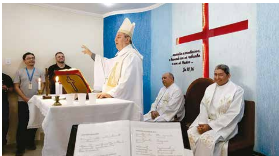
Missa com funcionários da Embraer