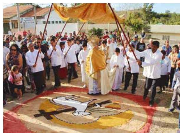
Paróquia Santa Luzia