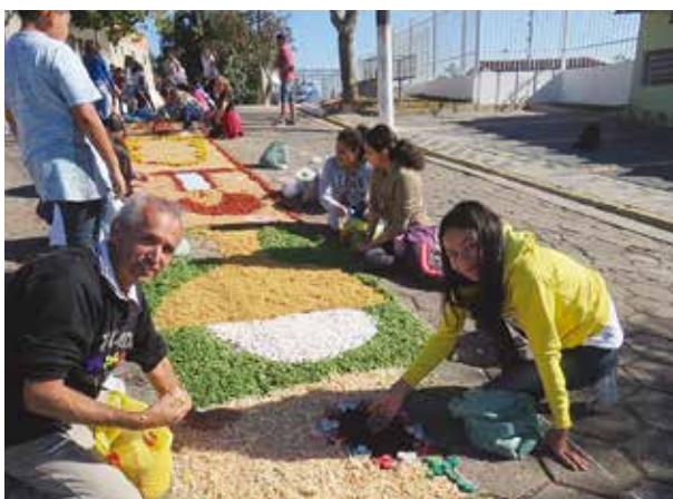
Paróquia Nossa Senhora do Patrocínio