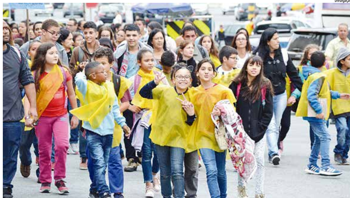
Catequizandos viveram uma experiência diferente no Santuário de Aparecida e Frei Galvão

“A intenção desse projeto é fazer uma catequese que eles possam vivenciar e participar não somente catequista e catequizando, mas uma catequese onde os interlocutores