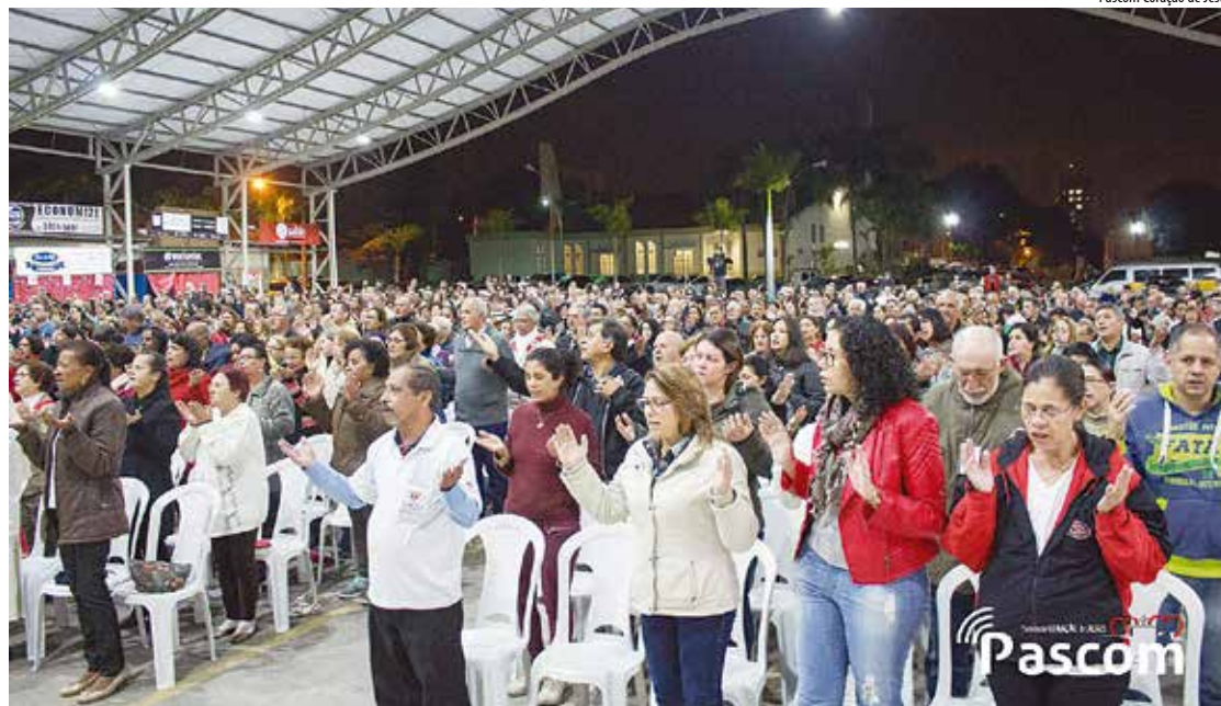
O aumento de católicos é expressivamente comprovado, conforme Relatório da Santa Sé. Na foto, a primeira paróquia instalada na Diocese, Coração de Jesus, reúne milhares de fiéis na novena do padroeiro.

Estes são dados publicados pelo serviço estatístico da Santa Sé, dos quais eu quis publicar um resumo para conhecimento de nossos leitores e também para que intensifiquemos a oração, as preces e os trabalhos em favor da Igreja Católica e de todas as suas vocações. É tempo de oração e de trabalho por todos os batizados e responsáveis pela construção do Reino de Deus.