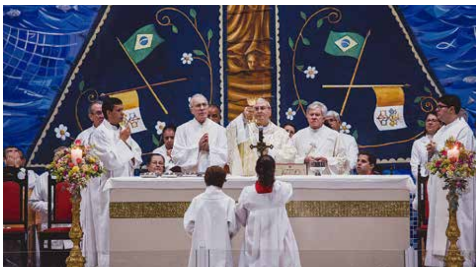
Missa do Padroeiro, Paróquia Coração de Jesus.