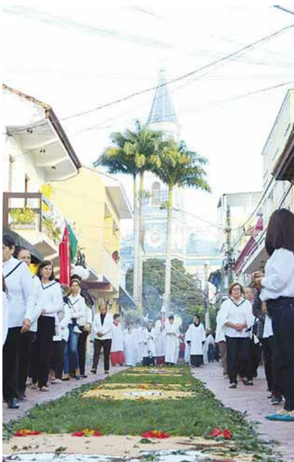
Paróquia Santo Antonio