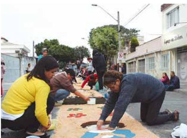
Paróquia de Santana