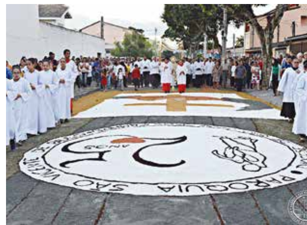
Paróquia São Vicente de Paulo