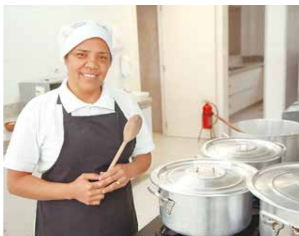
O amor converte em grande o que aos olhos humanos resulta ínfimo: "Fazei tudo por Amor".

Deus nos espera cada dia: no laboratório, na sala de operações de um hospital, no quartel, na cátedra universitária, na fábrica, na oficina, no campo, no seio do lar e em todo o imenso panorama do trabalho. Não esqueçamos nunca: há algo de santo, de divino, escondido nas situações mais comuns, algo que a cada um de nós compete descobrir".