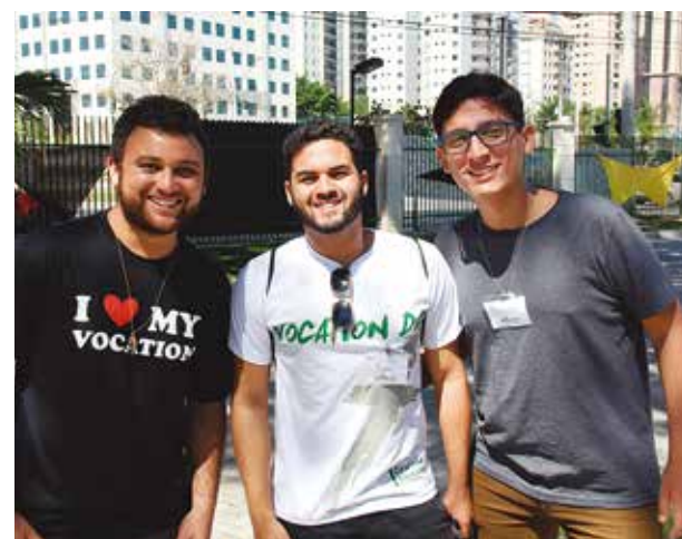
Todos somos chamados a ser santos, vivendo com amor e oferecendo o próprio testemunho nas ocupações de cada dia, onde cada um se encontra.