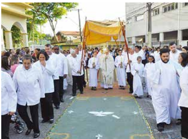
Paróquia São Sebastião