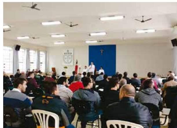
Jornada de Oração pela Santificação dos Sacerdotes.