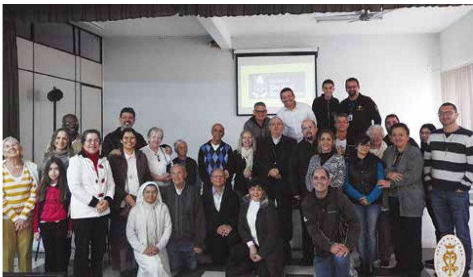
Visita Pastoral na Paróquia Imaculada Conceição, em Jacareí